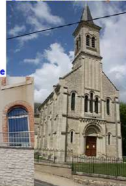
Musée de la Fonderie